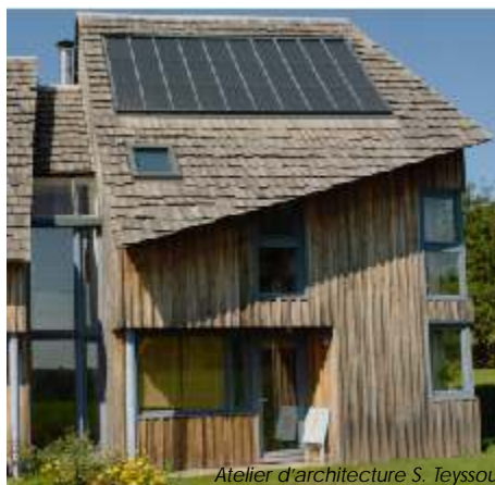
Atelier d'architecture S. Teyssou