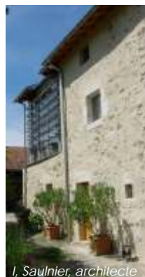
I. Saulnier, architecte