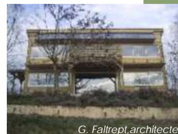
G. Faltept, architecte