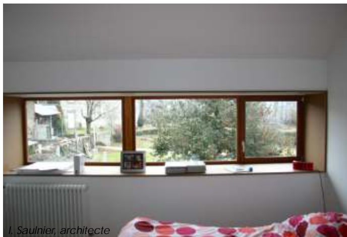
I. Saulnier, architecte