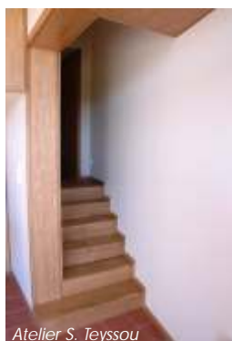
Atelier S. Teyssou