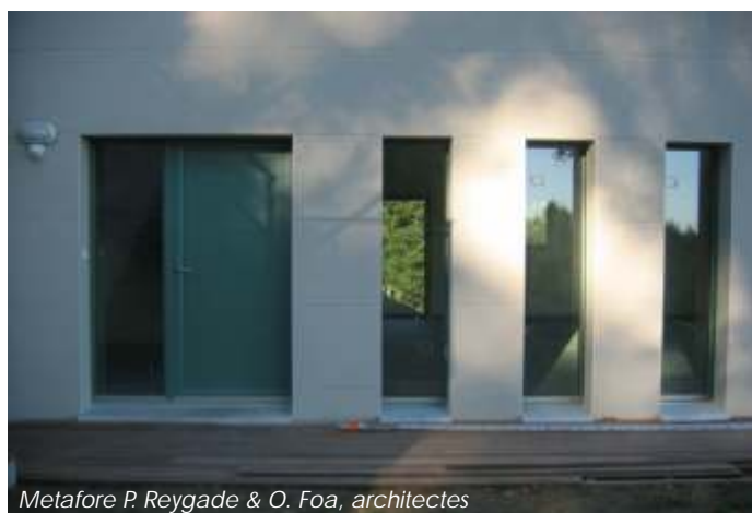
Metafore P. Reygade & O. Foa, architectes