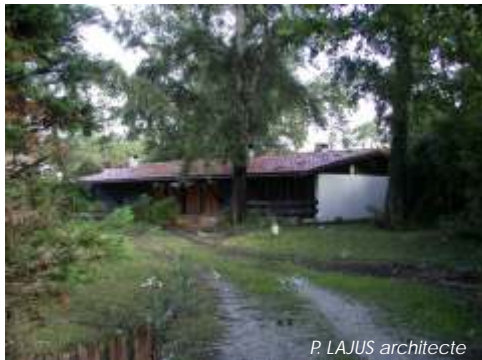
P. LAJUS architecte

Ainsi débute la loi sur l'architecture du 3 janvier 1977 qui fait naître le Conseil d'Architecture d'Urbanisme et de l'Environnement sur le territoire national. Cet organisme a pour mission la promotion de la qualité de l'architecture et de son environnement. Il fournit aux personnes qui désirent construire les informations, les orientations et les conseils propres à assurer la qualité architecturale des constructions et leur bonne insertion dans le site environnant, urbain ou rural, sans toutefois se charger de la maîtrise d'oeuvre.