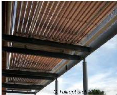
G. Faltept architecte