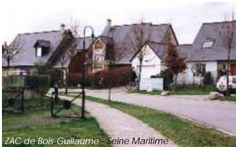
ZAC de Bois-Guillaume - Seine Maritime

La seconde étape consiste à trouver une réponse immédiate aux problèmes posés, soit par des documents remis ou des croquis.