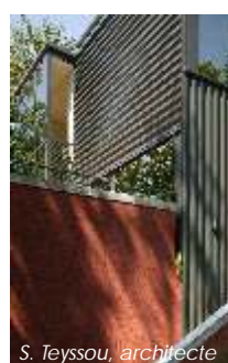
S. Teyssou, architecte