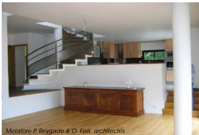
Metafore P. Reygade & O. Foa, architectes