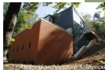
Atelier d'architecture S. Teyssou