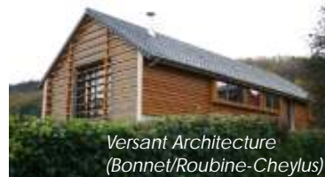
Versant Architecture (Bonnet/Roubine-Cheylus)