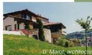
D. Marot, architecte