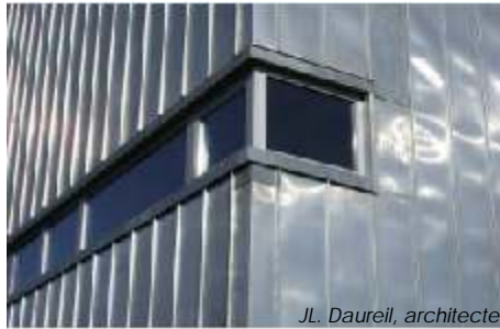
JL. Daureil, architecte