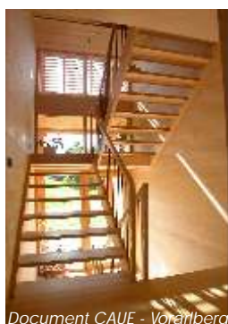
Document CAUE - Voralberg