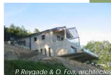
P. Reygade & O. Foa, architectes