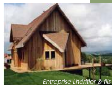
Entreprise Lhéritier & fils