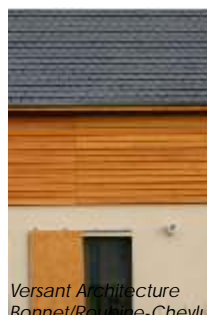
Versant Architecture Bonnet/Roubine-Cheylus